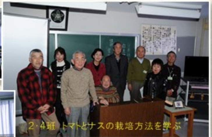
2・4班 トマトとナスの栽培方法を学ぶ