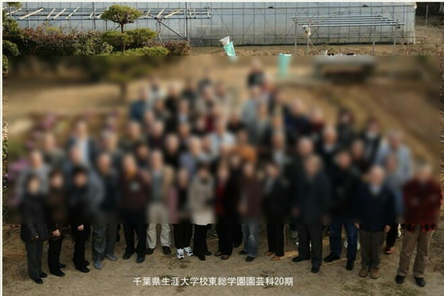
千葉県生涯大学校東総学園園芸科20期