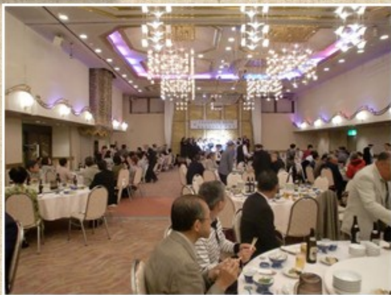
1年自治会総会懇親会