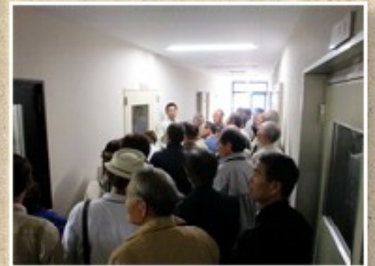
JA全農ちば 営農技術センター