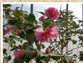
国立歴史民俗博物館