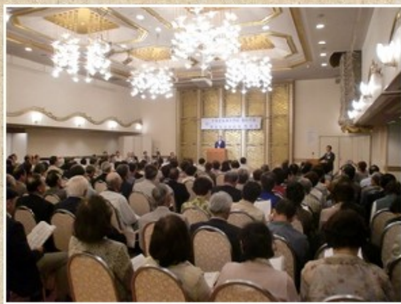
於：銚子プラザホテル