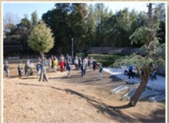
1年神崎町わくわく西の城剪定授業