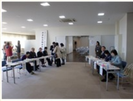
於：銚子市民センター