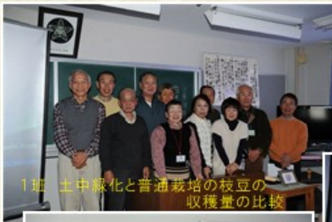
1班 土中緑化と普通栽培の枝豆の 収穫量の比較