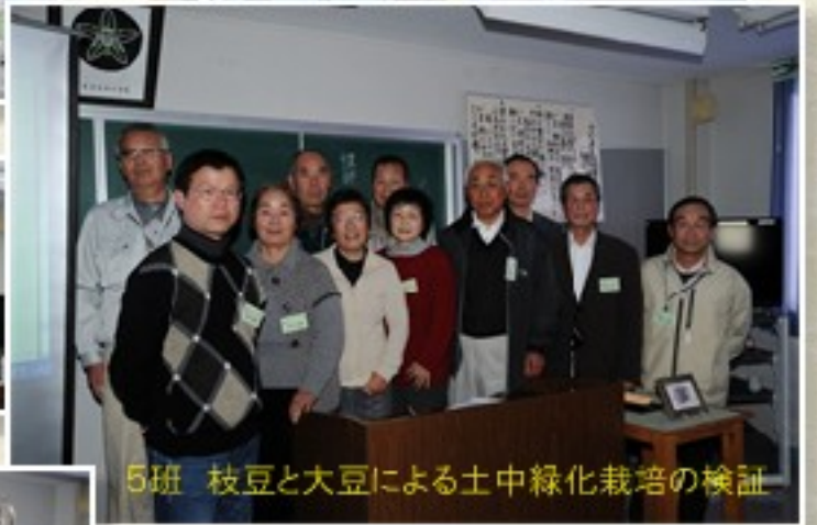
5班 枝豆と大豆による土中緑化栽培の検証