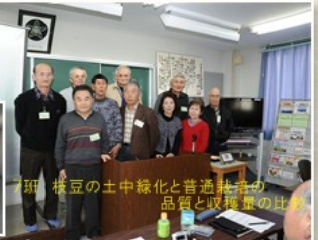
7班 枝豆の土中緑化と普通栽培の 品質と収穫量の比較