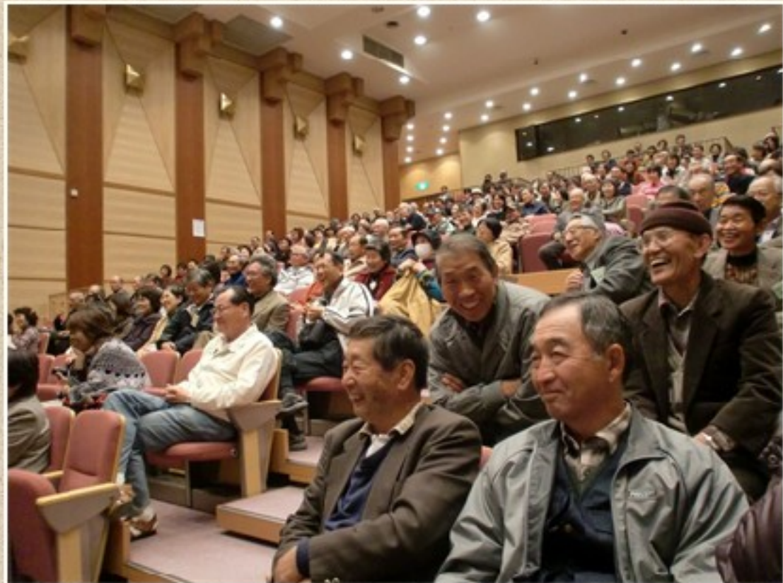
於：神崎ふれあいプラザ